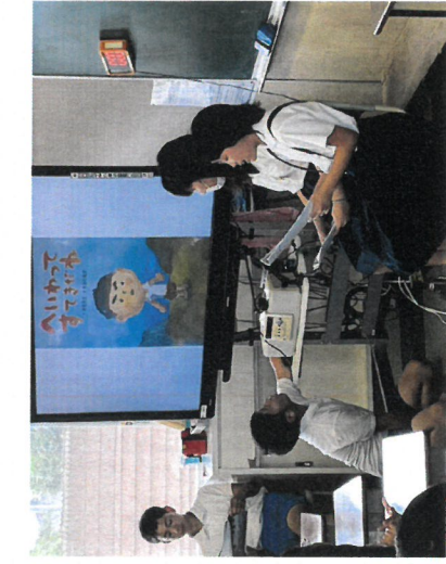
(平和を祈りながら読みました!)

6年生は、5月に長崎に修学旅行に行きました。現地では被爆者の方の話を聞き、平和公園や原爆資料館に行き、平和の尊さや戦争の恐ろしさを自分事として感じました。