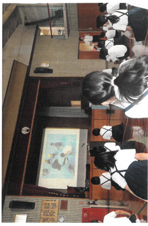
(北鹿島っ子は、みんなすばらしい!)